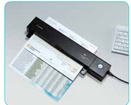
Documentinvoer voor 10 vel, met dubbelzijdige scanfunctie

De P-208II is tevens ideaal voor thuisgebruikers. De scanner is perfect geschikt voor het scannen van bonnen en rekeningen, en met de functie 'Picture Mode' kunnen oude foto's nauwkeurig worden gescand.