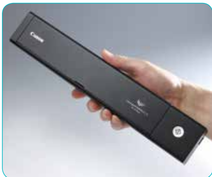
Ultraslank en licht

* Indien aangesloten op het accessoire WU10.